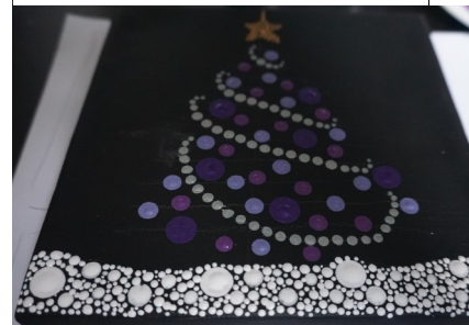
Schritt 5: Lackieren